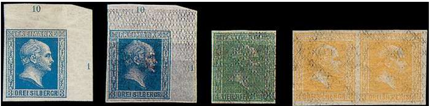
Typische Bleisulfidschäden der Kategorie III (Pos. 1 Originalzustand)

III) Die dritte Gruppe beeinträchtigter Marken betrifft Ausgaben, die als Fälschungsschutz mit einem normalerweise nicht sichtbaren Unterdruck versehen wurden (beispielsweise preußische Marken der zweiten und dritten Ausgabe oder bestimmte Marken des Norddeutschen Postbezirks). Dieser Unterdruck tritt in der Regel nur durch chemische Manipulation (z.B. durch Schwefelwasserstoff) schwarz oder braunschwarz zu Tage und führt dann zu einer erheblichen Wertminderung der betroffenen Marke. Auch hier konnte in den letzten Jahrzehnten eine extreme Häufung geschädigter Marken festgestellt werden.