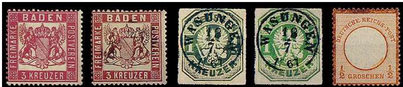
Bleisulfidschäden der Kategorie I (Beispiele, Pos. 1 und 4 Originalfarben)

I) Wir kennen klassische Marken, die aufgrund ihrer Farbzusammensetzung zur "Oxydation" neigen, vor allem Orange-, Gelb- und Rottöne. Bei diesen Marken waren in gewissem Umfang auch in der Vergangenheit Verfärbungen zu beobachten, wobei für die Veränderungen wohl in aller Regel unsachgemäße Lagerung, beispielsweise Feuchtigkeit- oder Temperatureinflüsse, verantwortlich waren. Seit etwa 1975 häuften sich farbveränderte Marken nach Lagerung unter PVC-Folien in besorgniserregendem Maße. Hinzu kamen jedoch neu auch Veränderungen anderer Farben wie Blau- oder Grüntöne. In allen Fällen konnte beobachtet werden, dass die Markenfarben dunkler wurden, vielfach bis zur völligen Schwarzfärbung. Weiter ließ sich beobachten, dass sich bestimmte Marken unter weitgehend luftdicht abgeschlossenen PVC-Folien grundsätzlich nach kurzer oder längerer Zeit verfärbten, während sie bei anderer Aufbewahrungsart, beispielsweise in handelsüblichen Klemmtaschen auf Albumblättern aus Karton oder etwa in Einsteckbüchern, keinen Schaden nahmen.